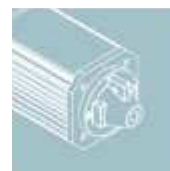
Awaryjny napęd bramy korbą lub linką

Solidny: Reduktor w kąpielii olejowej i przekładnie zębate z brązu.